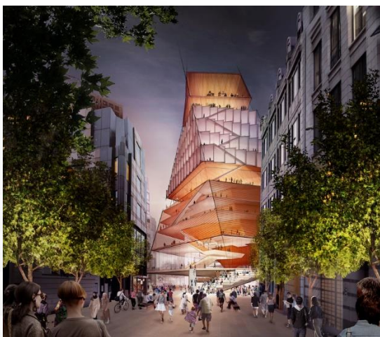
Návrh filharmonie v Londýně

Architekt Josef Pleskot neopomněl spojit architekturu s radostí z budování – tedy s něčím, čeho se nám v současnosti příliš nedostává. „Doporučoval bych Praze, aby tuto položku zařadila do svého repertoáru, případně do ní vkládala drobné pro budoucnost, “ uvedl Josef Pleskot. Na předposledním zářijovém Summitu architektury a rozvoje hovořil o plánu postavit v okolí stanice metra Vltavská nový koncertní sál pro Prahu třetího milénia, k čemuž se politikové v předvolebním čase hlásili. Jelikož v metropoli se žádný pokrok neudál, obrátil se Josef Pleskot k Londýnu. Tam se totiž inspirovali Labskou filharmonií v Hamburku a podobně ikonickou stavbu i přes všechny peripetie s Brexitem už připravují.