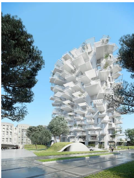
Bytový dům v Montpellier

Pro japonského architekta Suo Fujimota je hlavním mottem jednoznačně příroda a její prolínání s architekturou, vnímání vztahu vnitřku a vnějšku. „ Uvnitř je architektura, venku příroda, když ty hranice rozostříte, můžete je k sobě přiblížit. Pokud dokážete spojit jednoduchost a složitost, můžete začít propojovat architekturu s přírodou, “ uvedl Fujimoto, který vyrostl v lesnaté části ostrova Hokkaido, načež se přestěhoval do Tokia – jednoho z těch šílených, chaotických míst na zeměkouli. Jak je možné k tématům přistoupit ukázal na třech svých stavbách.