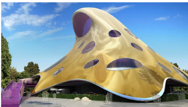
Kaplického návrh Národní knihovny