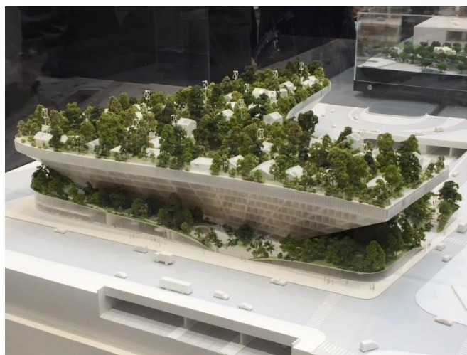
Projekt Tisíc stromů v Paříži

uvnitř, “ vysvětlil Fujimoto. Jeho další projekt propojil historii se současností. Tou tradicí byl životní styl, kdy si můžete díky příznivému počasí sednout na terasu i v únoru. Inovaci přinesly balkóny, které pojal architekt jinak, než je zvykem. Bytový dům ve francouzském Montpellier, který připomíná díky vysutým terasám kolem celého domu šišku nebo ananas, právě ožívá a architekt se těší, jak jej noví obyvatelé zabydlí. „U nových věcí nejde jen o to, že jsou nové, ale jak se zakomponují do života, co do něj mohou přinést nového, “ podotkl Fujimoto.