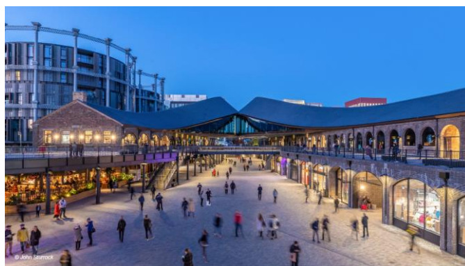
Revitalizace nádraží King's Cross

Jaký význam mají v architektuře i jiné veličiny než skleníkové plyny, jako například krása, emoce, experiment, kreativita a fantazie, přiblížili posluchačům známý britský architekt Ian Ritchie a následně i uznávaný německý urbanista slovenského původu Peter Gero. „Diskuse o regulacích není vůbec podstatná při tvorbě města, podstatný je nápad, masterplán, až potom změna územního plánu, který je spíše korzetem. Neplývejte příliš času na tvorbu výborných zákonů. Moje motto je, že ne hned vědomosti jsou důležité, ale fantazie, která nás přivede k řešení bez bariér. Pak přicházejí řešení, která jsou pionýrská jako třeba uložení hlavní cesty pod zem v Oslo, “ nabádal Peter Gero. I on se ale v závěru přednášky vrátil k tomu, že o úspěchu nových čtvrtí rozhoduje právě to, jak se podaří pracovat s veřejným prostorem.